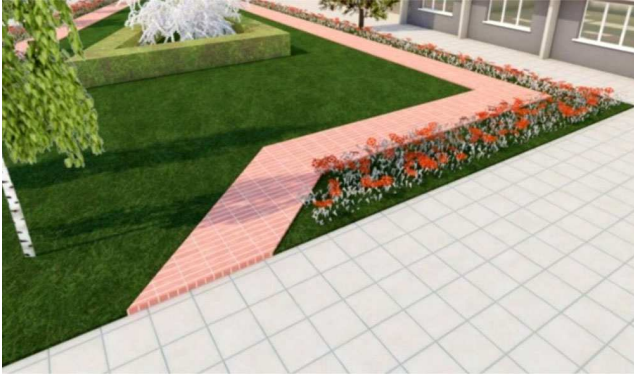
Рис. 3. Доріжка для прогулянок у зоні відпочинку / Walkway in the rest area

Зону справа від центрального входу (зона кафе) плануємо оновити за допомогою декоративних рослин у кашпо (рис. 4), в яких буде посаджено дві форми рослин пірамідальної та плакучої форм, для створення контрастності території.