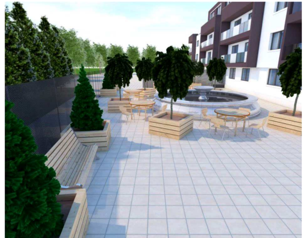
Рис. 4. Зона кафе з елементами озеленення та благоустрою / Café area with elements of landscaping and improvements

трального входу до готелю та будуть зручними у використанні для літніх людей та людей з обмеженими можливостями. Планом озеленення передбачено висаджування таких рослин (табл. 4).