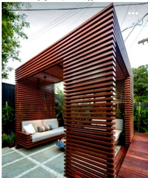
Рис. 2. Альтанка для зони відпочинку / Gazebo for rest area

Багато насаджень на території проєктованої ділянки було закладено без урахування правил стилістики. Оскільки рослини розташовані здебільшого хаотично, треба було приділити увагу гармонійному поєднанню їх зі стилістикою майбутнього озеленення. Реконструкція зелених насаджень та благоустрою території надасть об'єкту цікавого та комфортного вигляду. Із архітектурних елементів проєктуємо встановлення альтанки для зони відпочинку (рис. 2), лавок, урн для сміття.