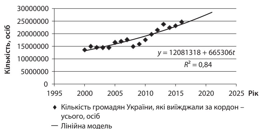
Рис. 2. Лінійна модель тренду кількості громадян України, які виїжджали за кордон у 2000–2017 рр.