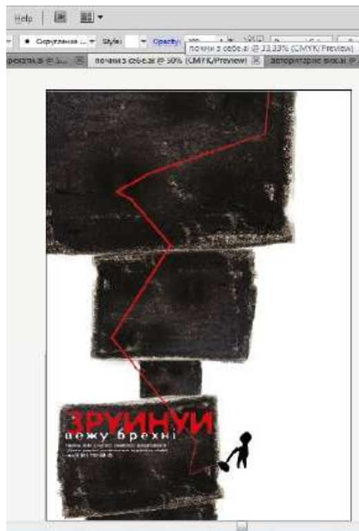
Рис. 1. 8 зруйнуй вежу брехні