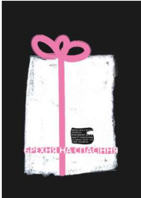
Рис. 2.6 Остаточний варіант плакату «Брехня на спасіння»