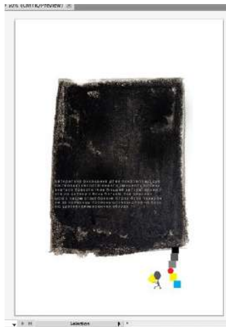
Рис. 1.6. авторитарне виховання