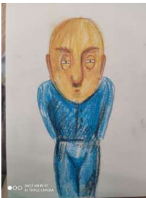
Рис. 1.1. початкові ескізи авторитарне виховання