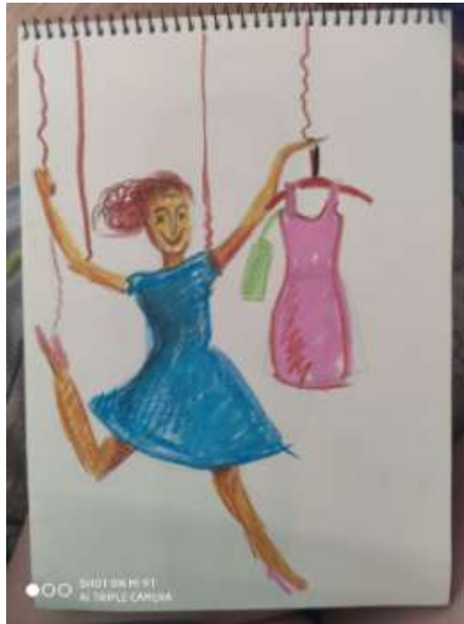
Рис. 1.3. жіноча брехня