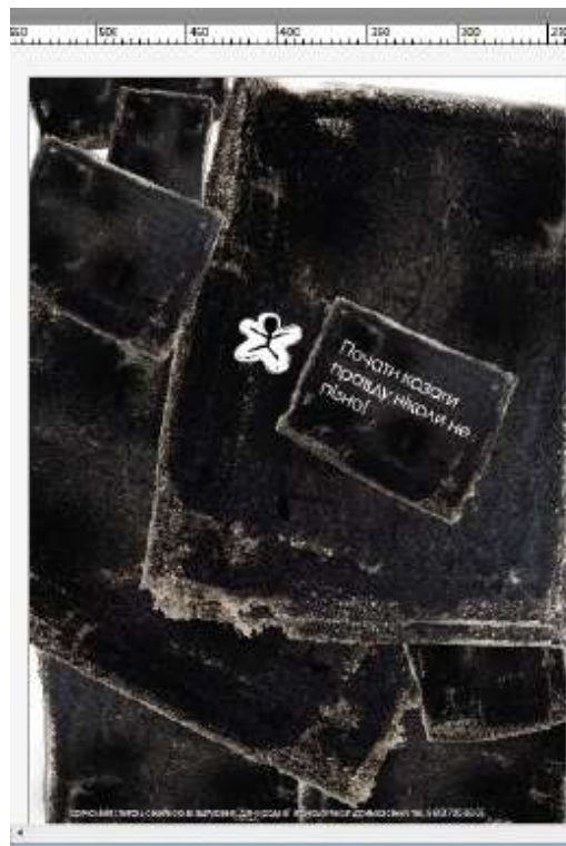
Рис. 2. 1 Почати казати правду ніколи не пізно