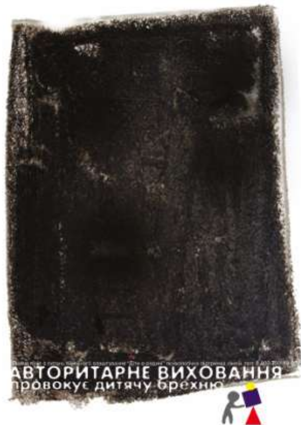
Рис. 2.5 Остаточний варіант плакату «Авторитарне виховання»