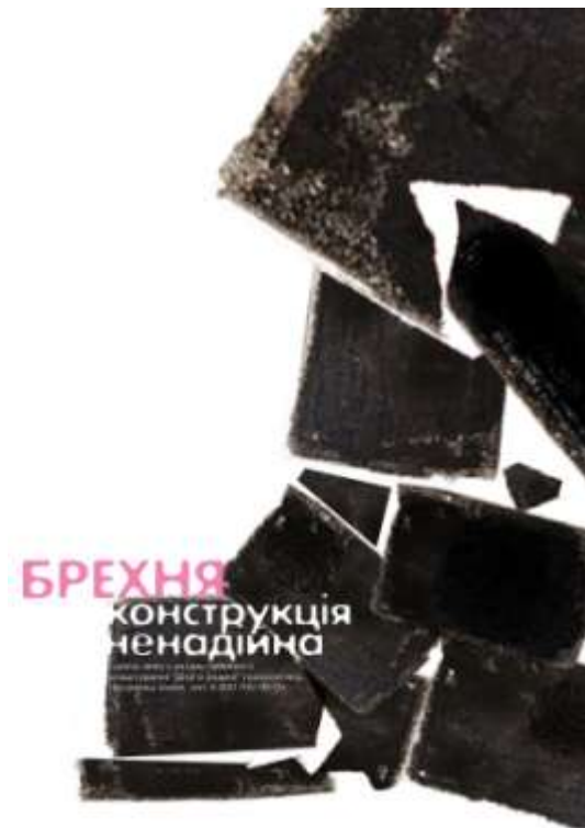
Рис. 3.1 Остаточний варіант плакату «Брехня конструкція не надійна»