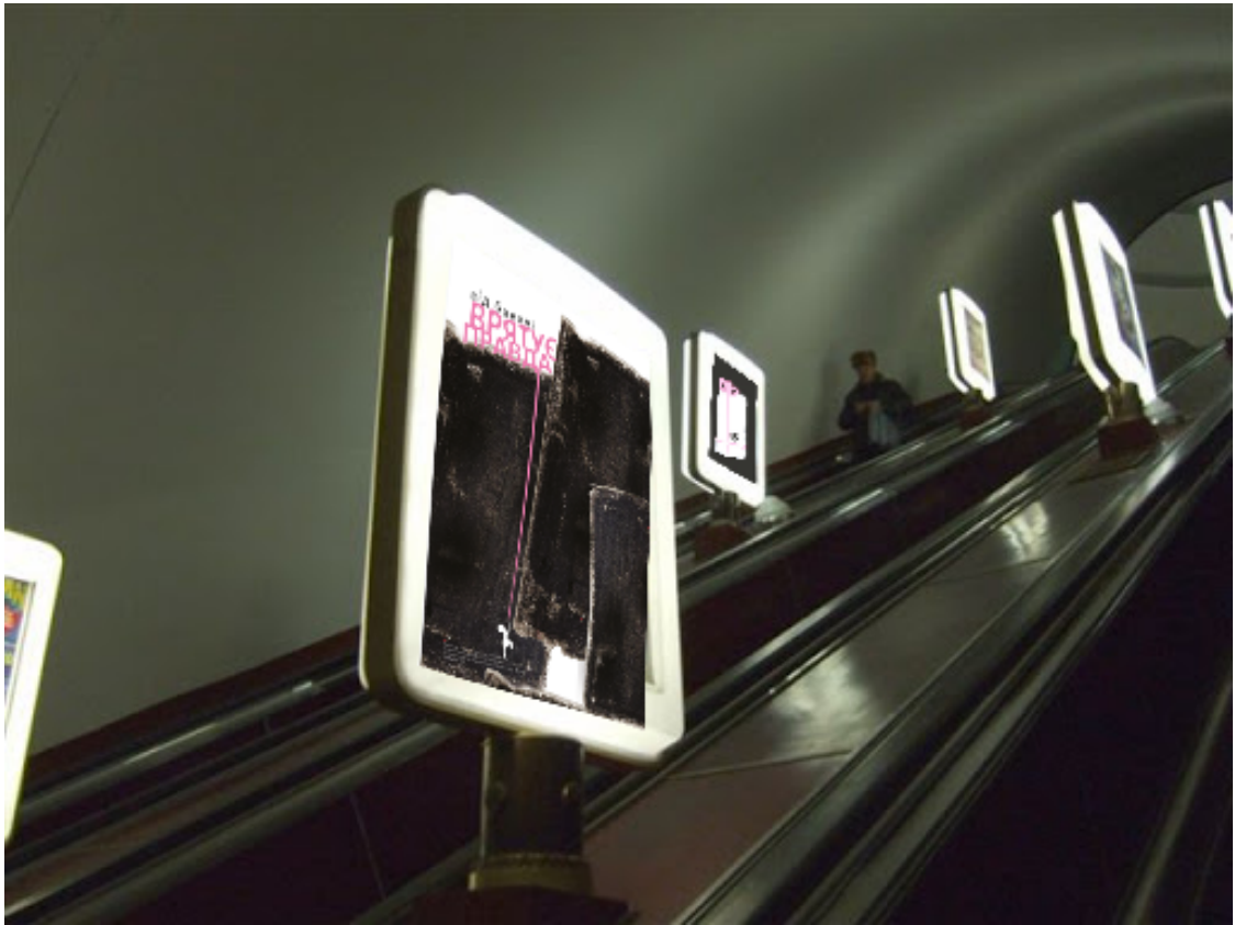
Рис. 3. 5 Соціальні плакати в метро