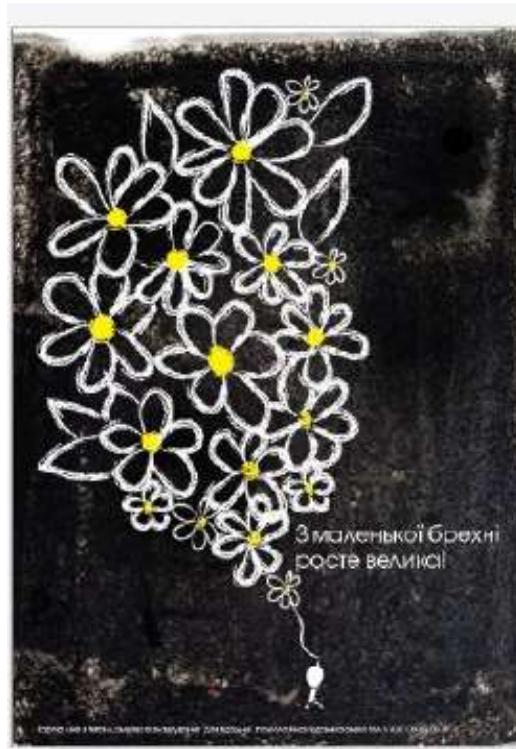
Рис. 2.2 З маленької брехні виростає велика