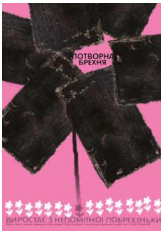
Рис. 3. 3 Остаточний варіант плакату «Потворна брехня»