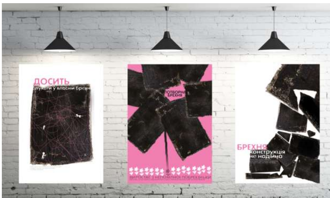
Рис. 3.4 Соціальні плакати в виставковому залі