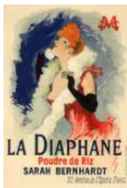
Рис. 1.1. Жюль Шере. Реклама пудри для жінок

У 1838 році парижанин Годфруа Енгельманн вигдав хромолітографічний метод друку. За це досягнення він отримав нагороду у 2000 франків. Також в цей час російський художник Корнилій Якович Тромонін вже надрукував ілюстрації про князя Святослава тим же методом. Корнилій Тромонін почав першим видавати альбоми з кольоровими ілюстраціями. У 1865 році австрійський барон фон Рансонет винайшов метод фотохромолітографії. В цій техніці використовувалося три фарби: синя, жовта, червона. Завдяки такому обсягу фарб можливо було отримати майже будь-який колір. Так з'явився масовий тираж.