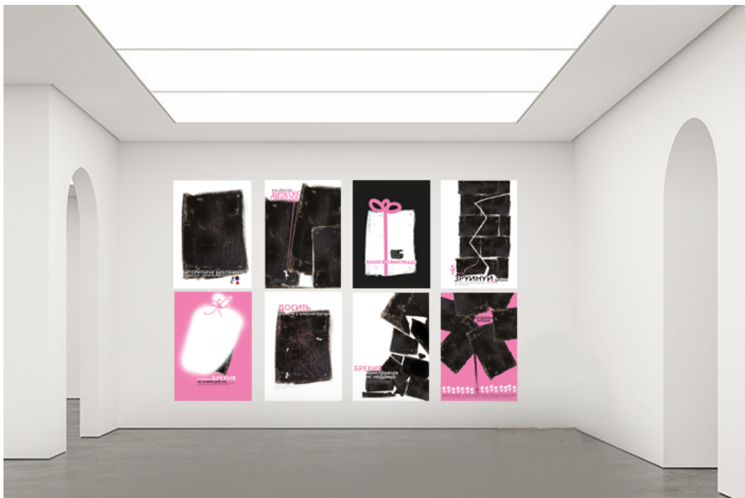
Рис. 3. 6 Серія соціальних плакатів в виставковому залі