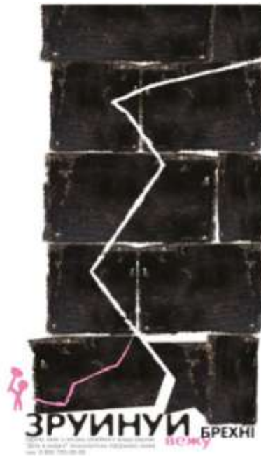
Рис. 2.9 Остаточний варіант плакату «Зруйнууй вежу брехні»