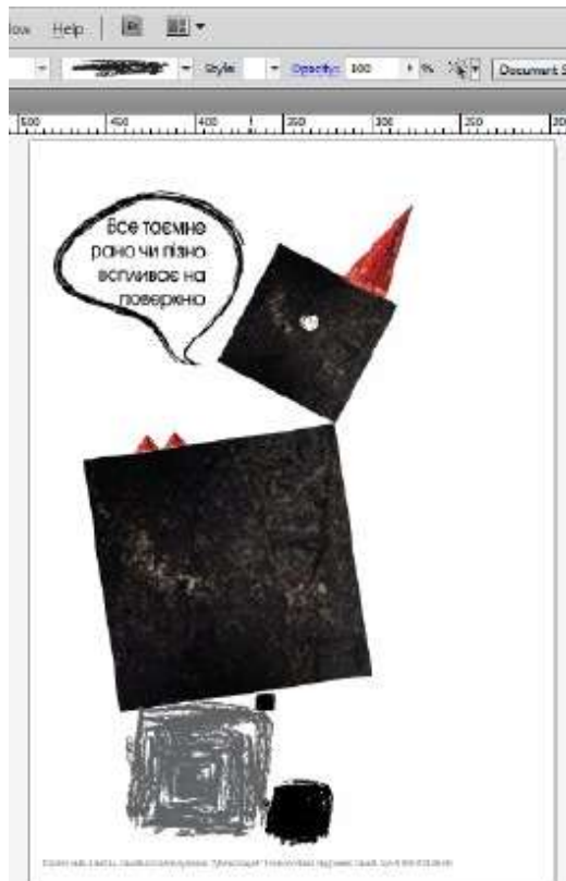
Рис. 1.9 початкові ескізи плакату «Все таємне рано чи пізно впливає»