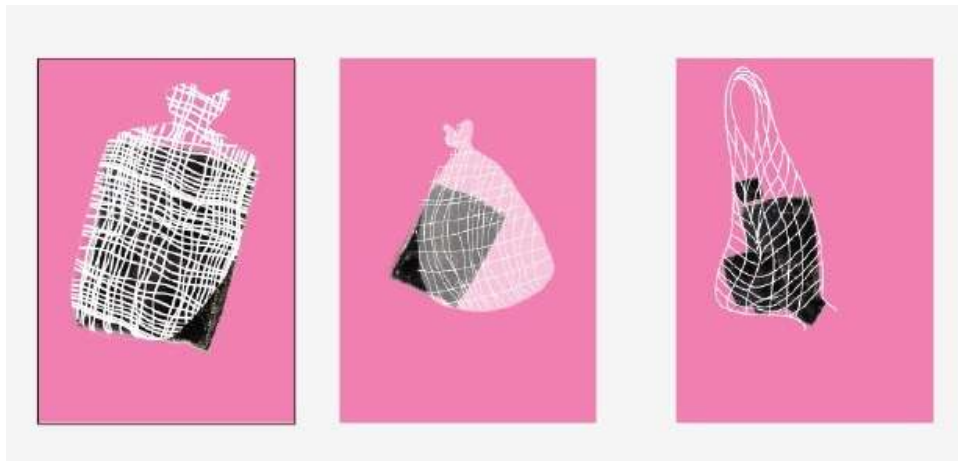
Рис. 2.4 Початкові ескізи плакату «Солодка брехня»