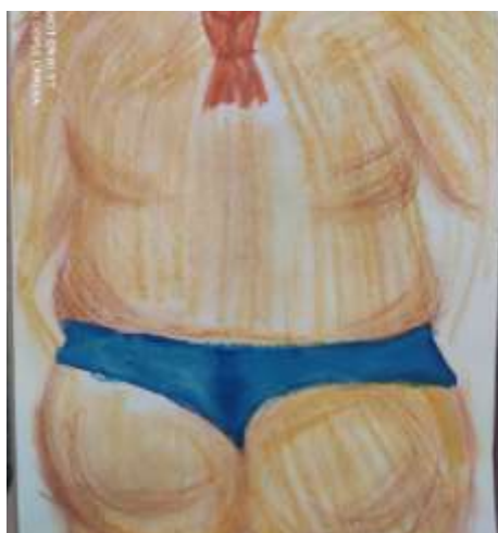
Рис. 1.2 брехня на благо «кохана ти зовсім не товста»