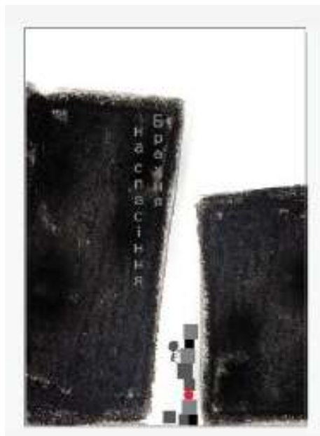
Рис. 1.5. брехня на спасіння