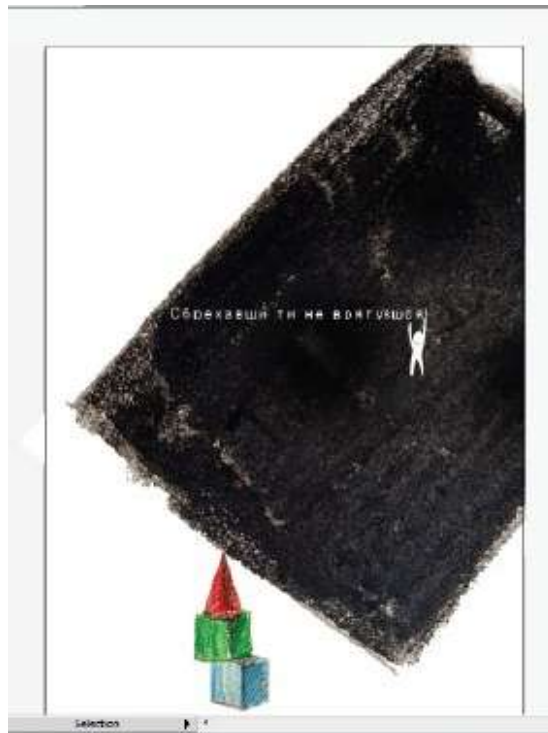
Рис. 1.7 брехня не врятує