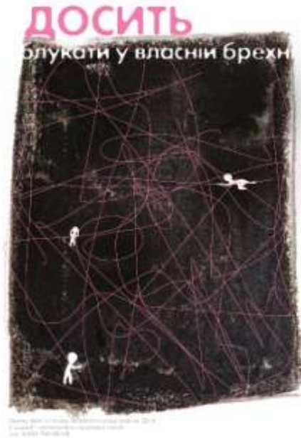
Рис. 2.8 Остаточний варіант плакату «Досить блукати у власній брехні»