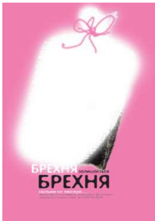
Рис. 3.2 Остаточний варіант плакату «Брехня залишається брехня, скільки не маскуй»