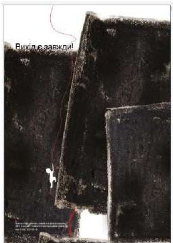
Рис. 2.3 Вихід є завжди