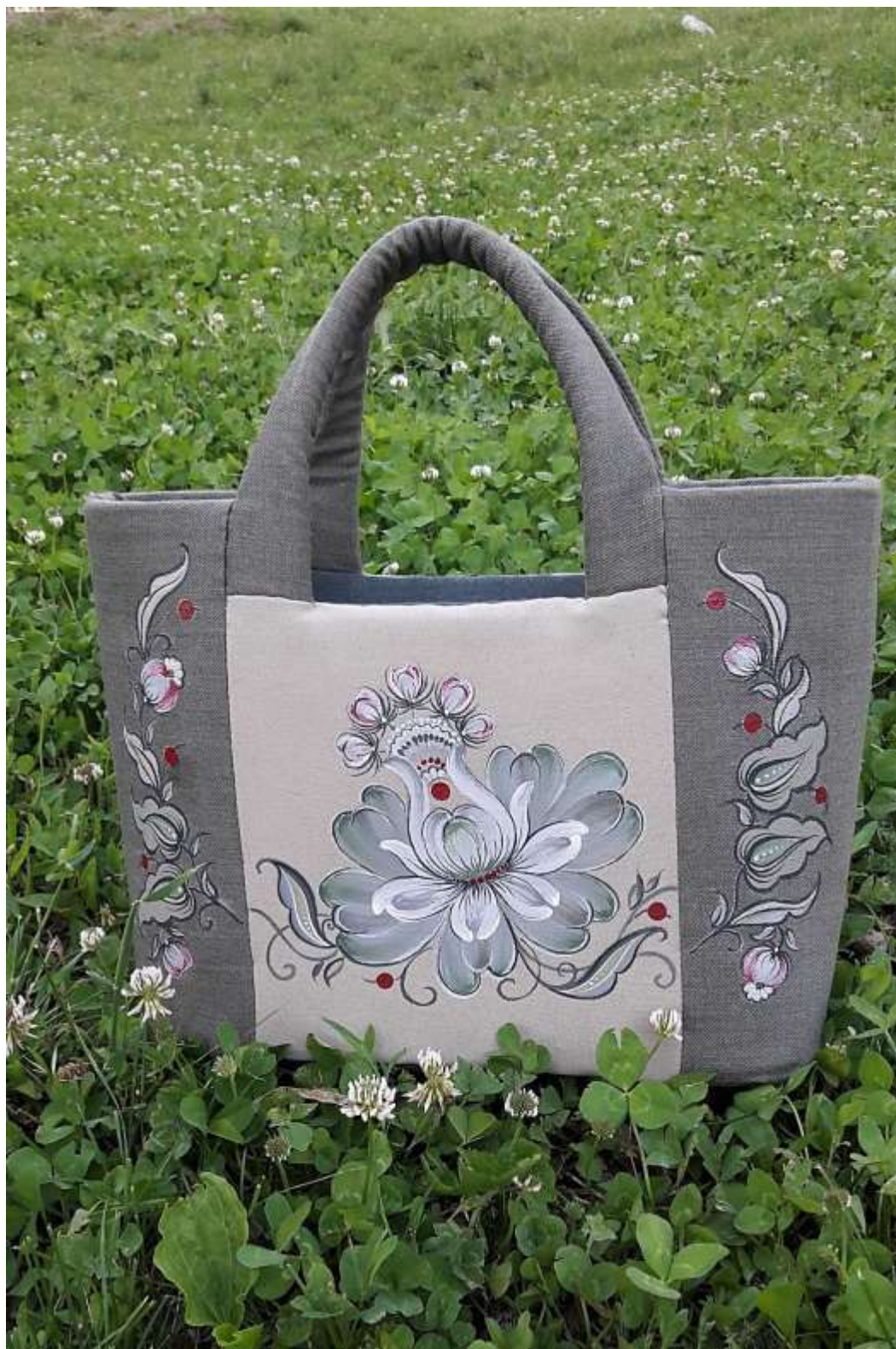
Рис. 1. Сумка з етносерії в природньому середовищі