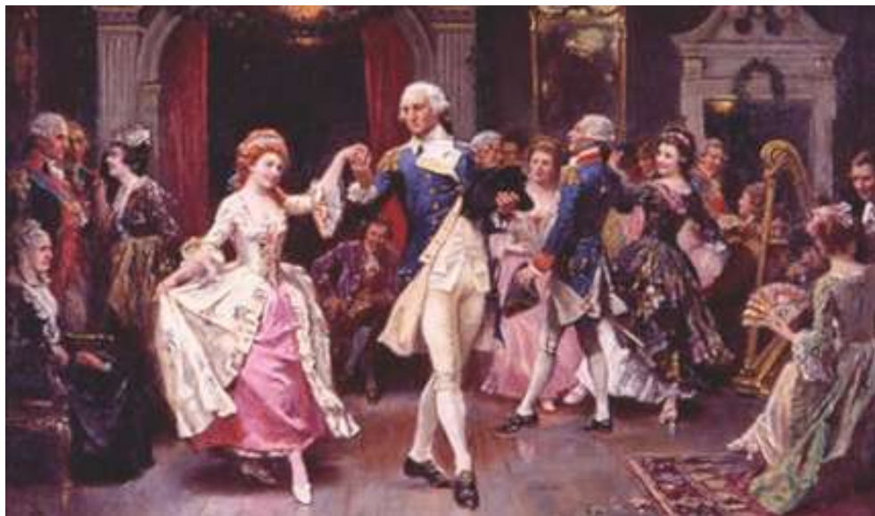
Рис. 4. Танець «менует»

Згодом балльні танці прискорюються, збагачуються стрибками, поворотами, витонченими позами. З'явилися менует, рігодан, романеско.