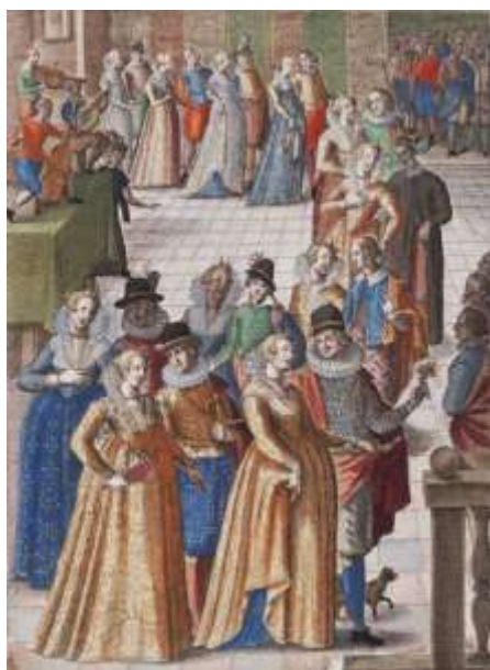
Рис. 2. Світський бал

Потім отримала популярність павана, яку танцювали з факелами або канделябрами в руках. Француз Туано Арбо в 14 столітті описав різні танці в «Орхезографії». Бальні танці виконувалися в супроводі невеликого оркестру з кларнетів, тромбона і віоли або скрипок.