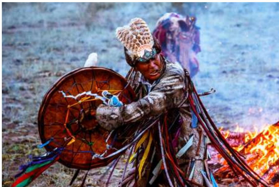
Рис. 1. Танець шамана

Під час розквіту лицарської культури в 12 столітті виникли перші світські або бальні танці – все почалося з танцю бранль у Франції.