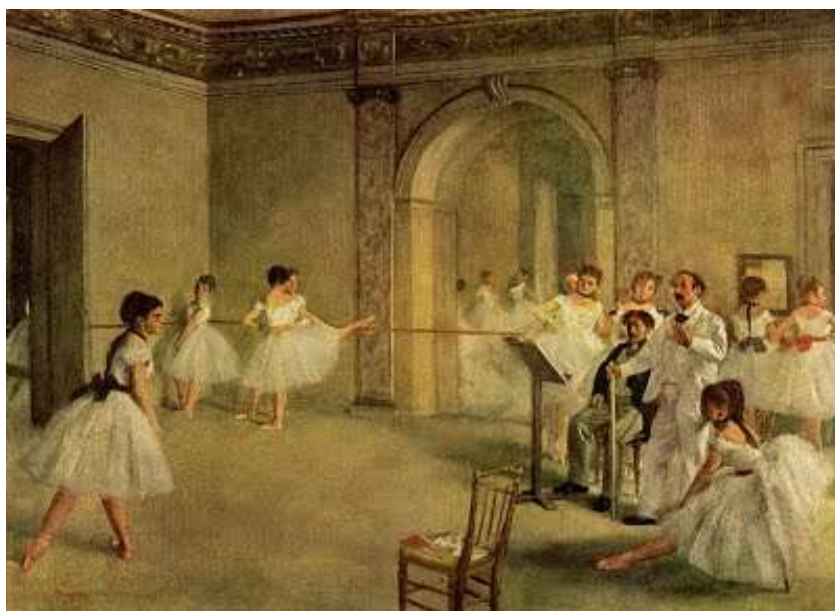
Рис. 5. Балетна школа

Танцмейстери і педагоги 17 століття випускають самовчителі з танців, оскільки танцю вже потрібно довго навчатися. У 1661 році за указом Людовика XIV в Парижі була відкрита «Академія танцю». Перший французький балет відкрив шлях до найдосконалішої форми пластичного мистецтва. Балети стали частиною розкішних, величезних святкових феєрій, які тривали кілька днів поспіль і включали в себе всі види розваг.