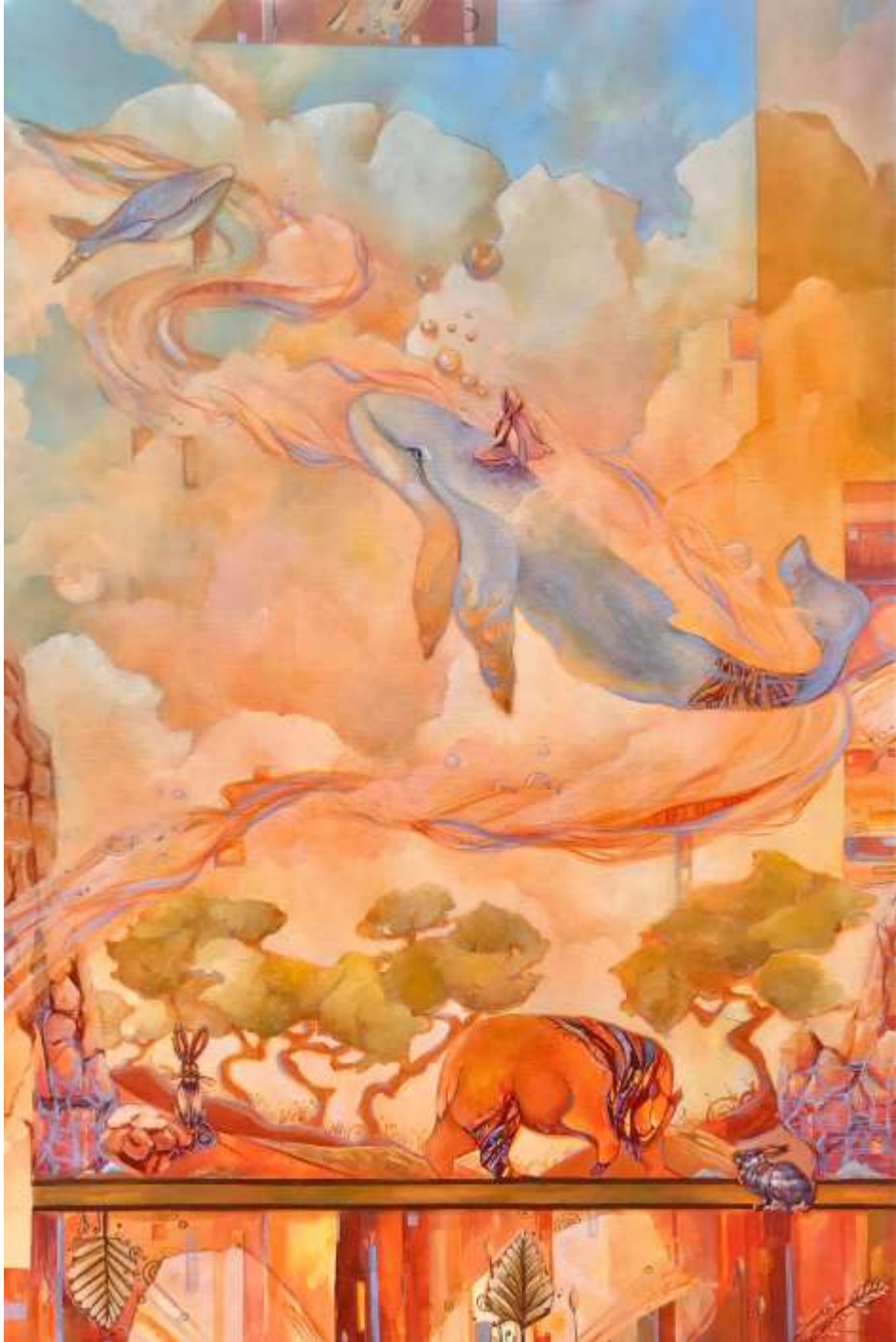
Рис. 1. Остаточний варіант виконання декоративного панно