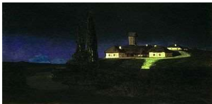
Рис. 1.1. Куїнджи А. «Українська ніч»

У період романтизму символізм виявлявся у романтичному пейзажі. Романтизм і романтичний жанр у пейзажі виникли на початку ХІХ сторіччя під впливом звернення світоглядних орієнтирів на силу людських почуттів втілених у художніх образах чуттєвої природи. У творах художників-романтиків поняття форми і змісту, втілених у художніх образах стали невід'ємними один від одного. Ці роботи виражають розуміння природи як частини божественного всесвіту, а її божественна природа виявляється у возз'єднанні з людиною через пейзаж. Романтичний пейзаж виявляє стани смутку, наснаги, драматизму і навіть трагедії [7]. Прикладами романтичного пейзажу є живописні твори Джона Констебла «Бричка для сіна» (1821), Теодора Жеріко «Пейзаж з акведуком» (1818), Вільяма Тернера «Схід сонця з морськими чудовиськами» (1845), Ежена Делакруа «Вид з моря з вершини Д'єппа» (1852), українського художника Архипа Куїнджи «Вечір на Україні» (1878) (Рис. 1.1.).