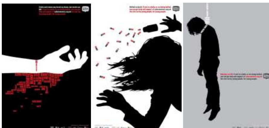
Рис. 3. J. Calzaghe «Bullying and Suicide Prevention Posters»