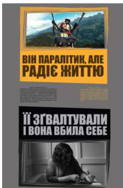
Рис. 2. Другий плакат