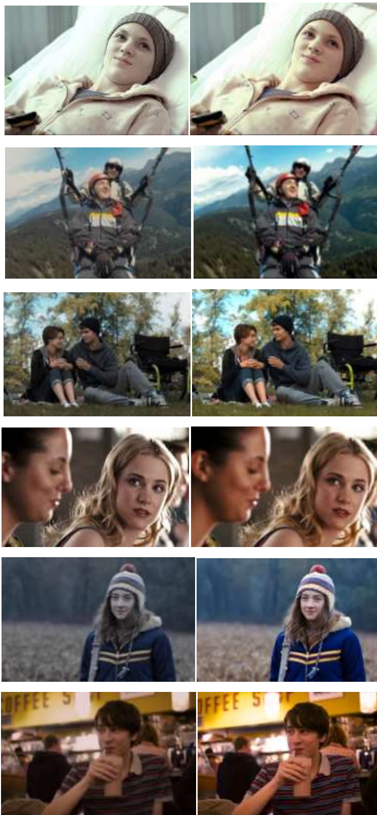
Рис. 1. Застосування фільтрів, які дозволили поліпшити яскравість і контрастність фото