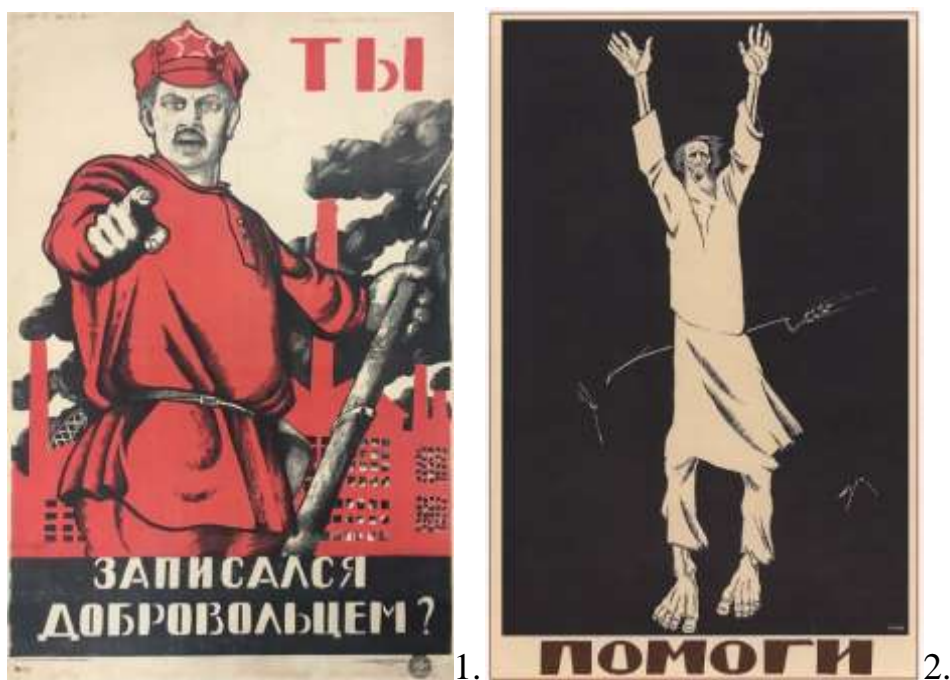
Рис. 1. Д. Моор «Ти записався добровольцем?», 1920р.