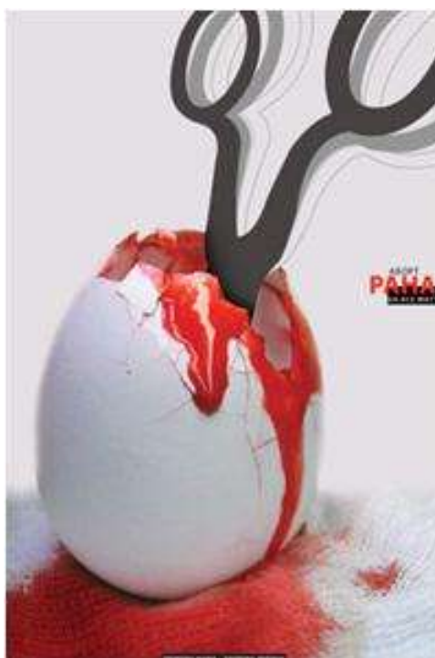
Рис. 4. Фестиваль «Три крапки...», плакат «Рана»