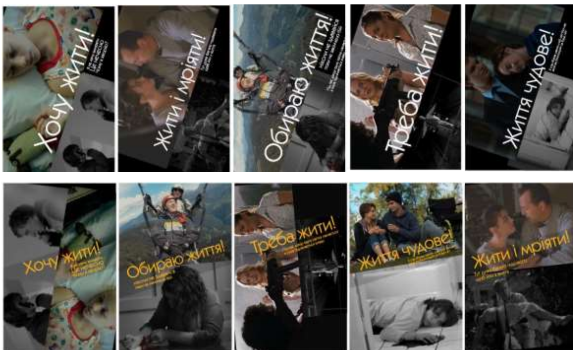
Рис. 3. Варіанти плакатів з двома картинками