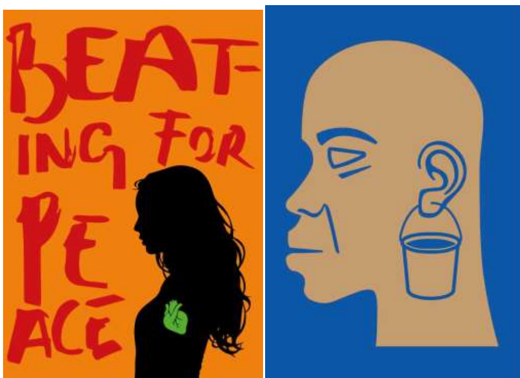
Рис. 2. Фестиваль «4 блок»: експозиція плакатів: «Sel Turkey Women», «Women and piese», Dariush Allahuari