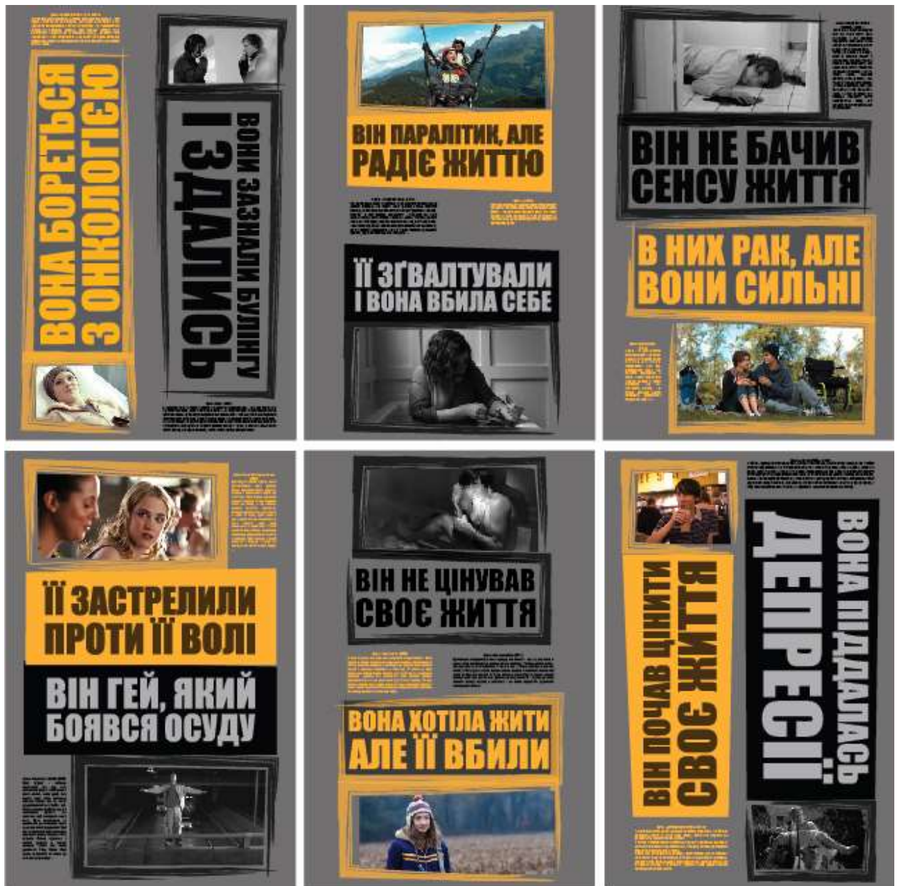
Рис.7. Перший варіант експозиції (по 3 плакати в два ряди)