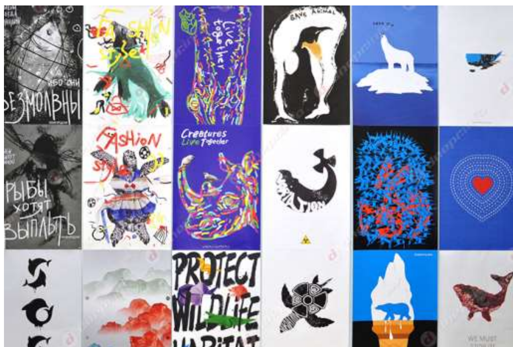
Рис. 3. Фестиваль «Корова», експозиція плакатів