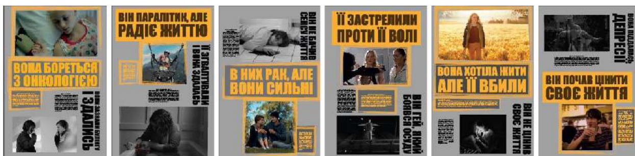
Рис. 3. Варіанти плакатів із світло-сірим фоном