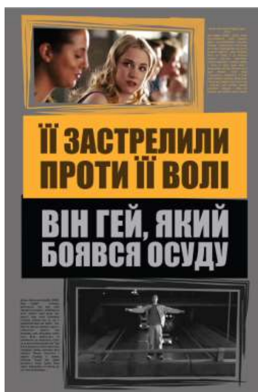
Рис. 4. Четвертий плакат