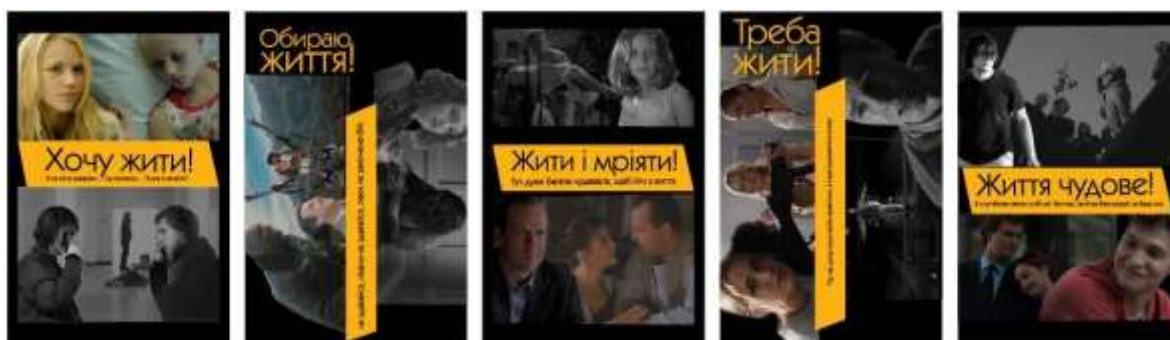
Рис. 2. Варіанти плакатів з використанням кольорових плашок