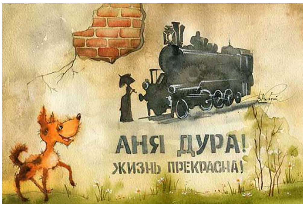
Рис. 1. В. Кірдій, «Аня дура ! Життя прекрасне!»