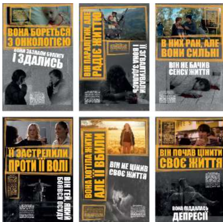
Рис. 1. Варіанти плакатів із збільшеним шрифтом