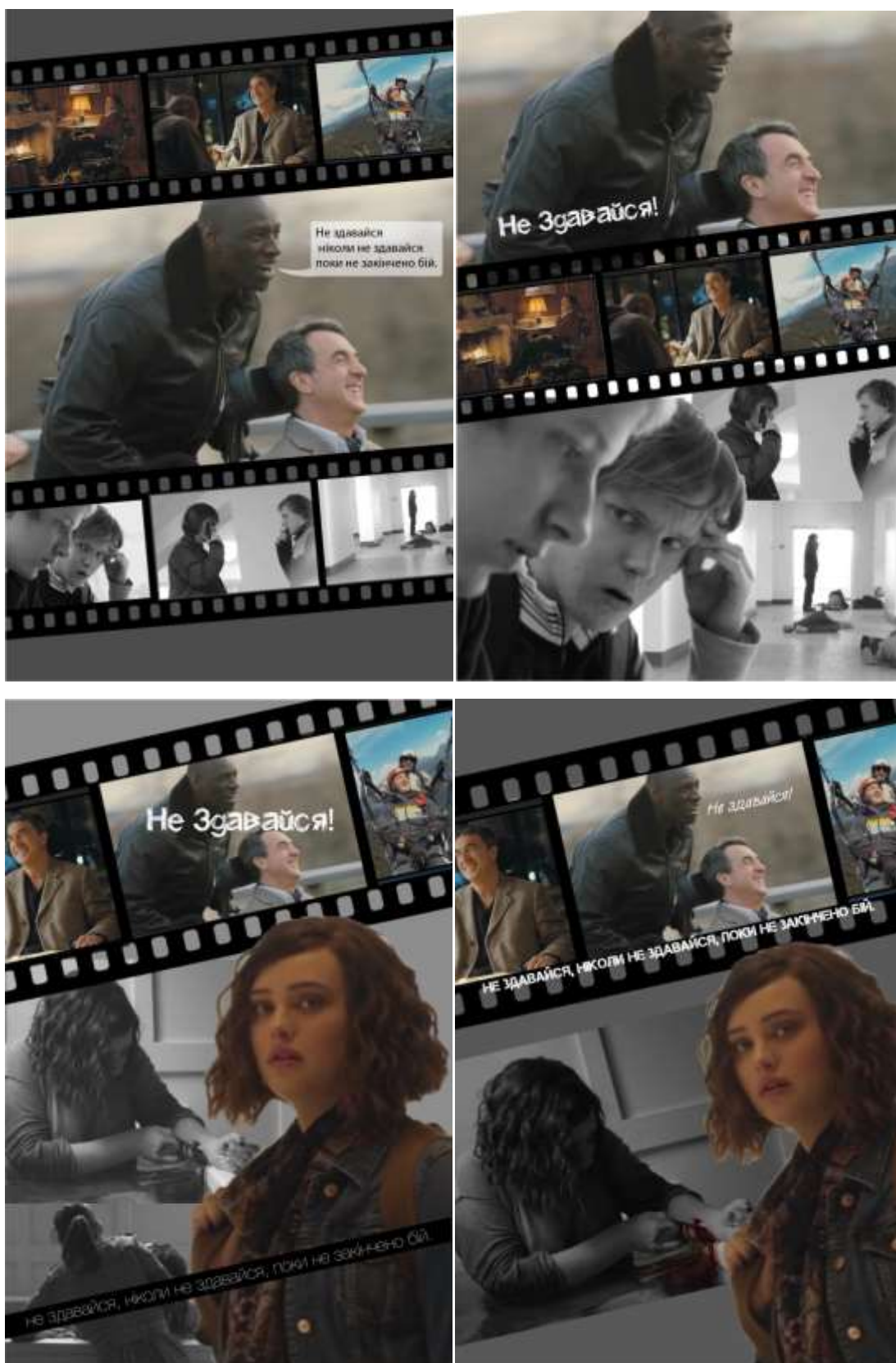
Рис. 1. Варіанти плакатів з використанням кіноленти