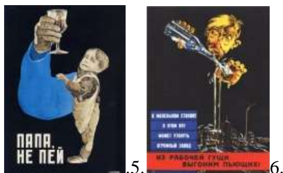
Рис. 5. Д.Буланов «Батьку, не пий», 1929 р.