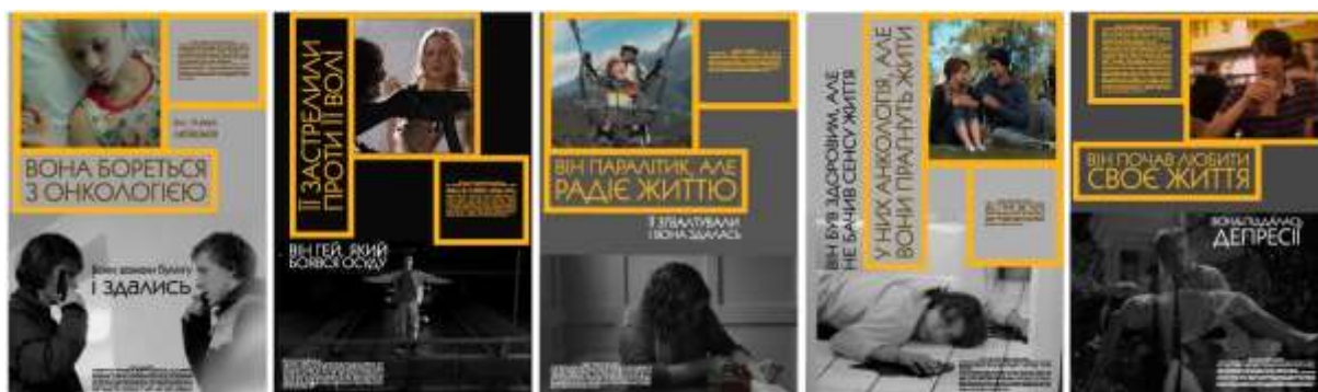
Рис.5. Варіанти плакатів з додаванням рамок