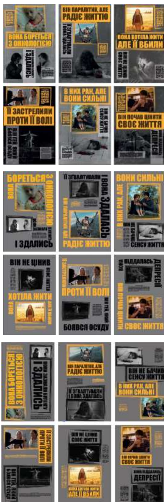
Рис. 5. Пошук остаточної шрифтової композиції