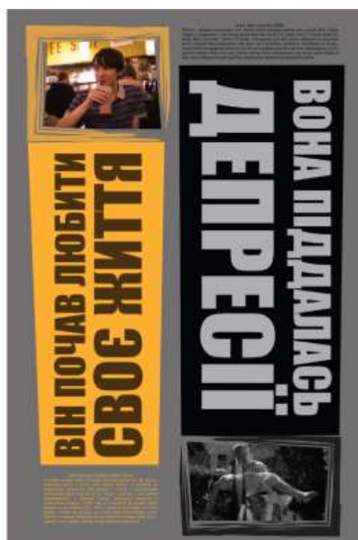
Рис. 6. Шостий плакат