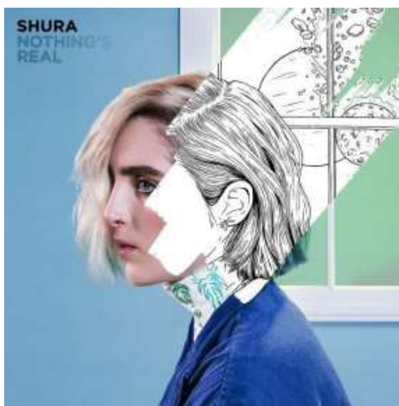
Рис.6. Автор невідомий, плакат «Nothing real»