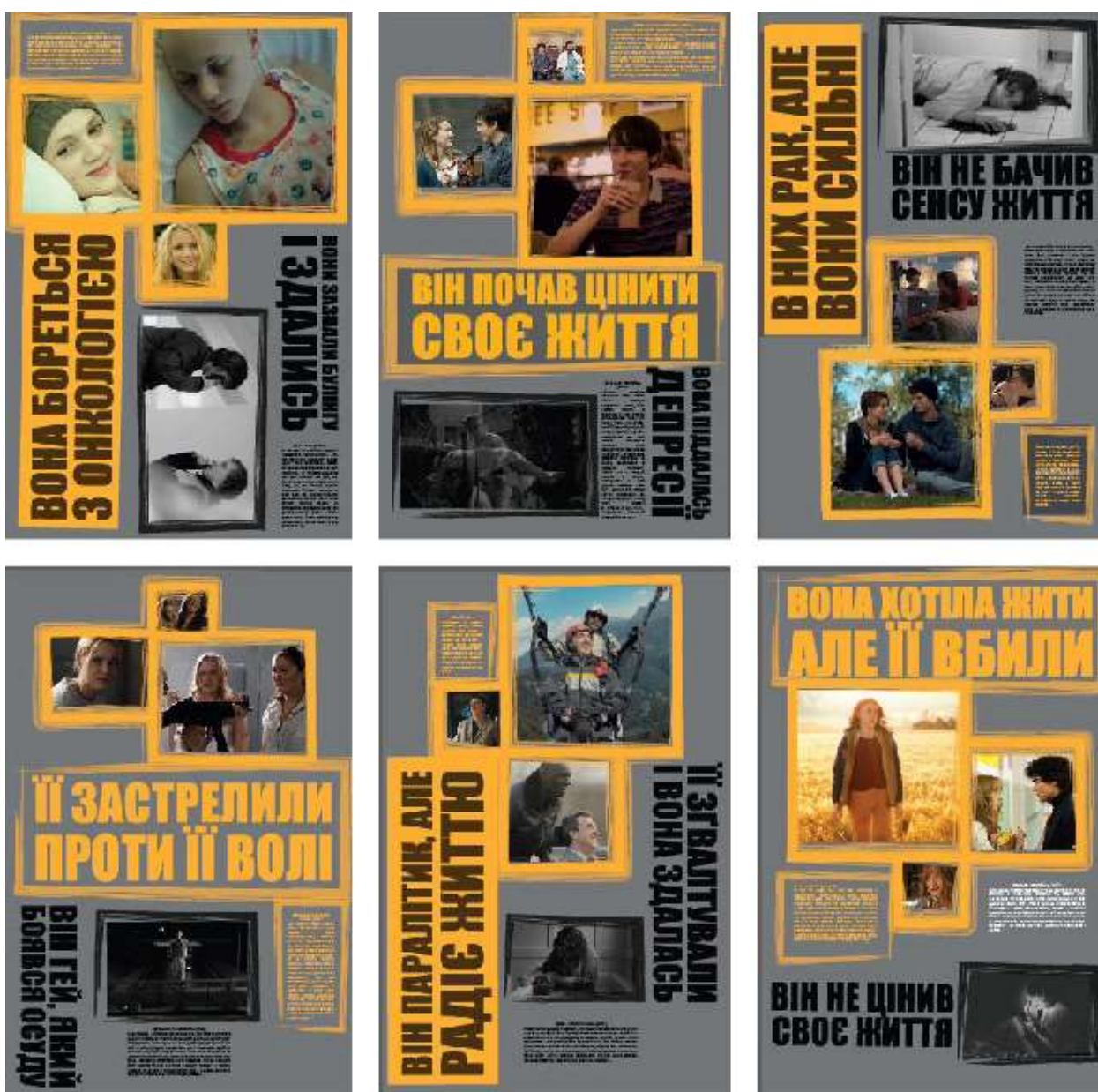
Рис. 4. Варіанти плакатів із використання чотирьох картинок