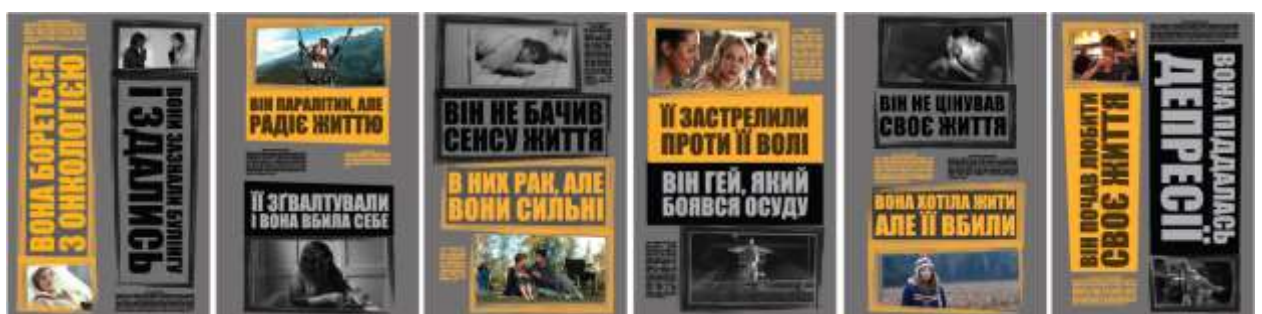
Рис.8. Другий варіант експозиції ( 6 плакатів в один ряд)