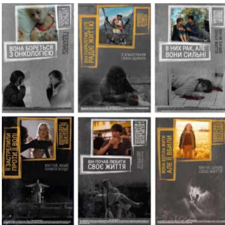
Рис.6. Варіанти плакатів з графічно-обробленими рамками та фоном