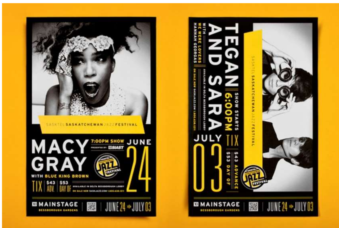
Рис.7. Автор невідомий, плакати до джазового фестивалю «Sasktel saskatchewan jazz festival»