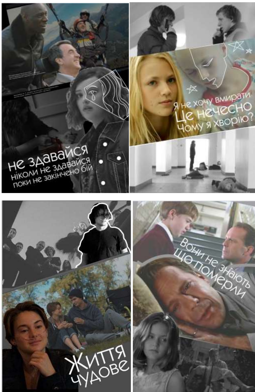
Рис. 2. Варіанти плакатів з використанням графічних елементів та фраз з фільмів