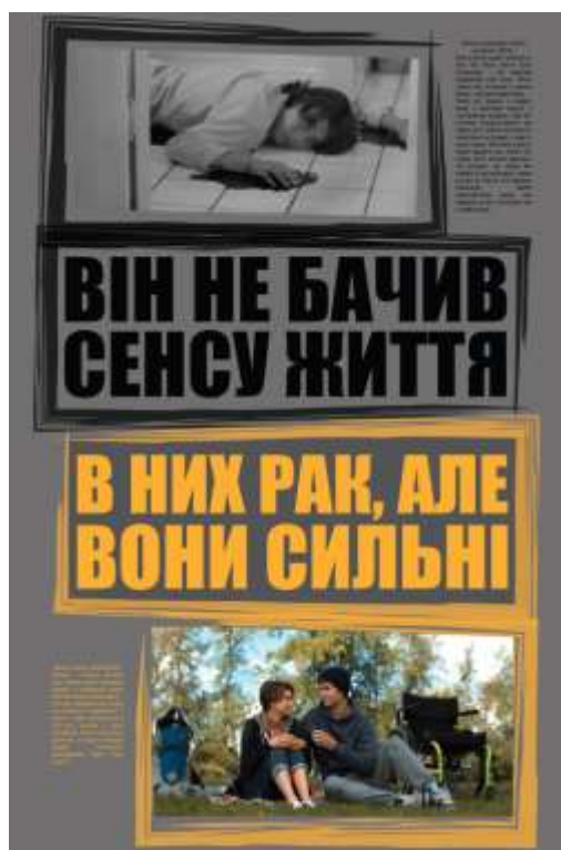
Рис. 3. Третій плакат