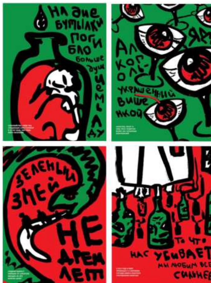
Рис. 5. А. Беляєва, серія соціальних плакатів на тему алкоголізму