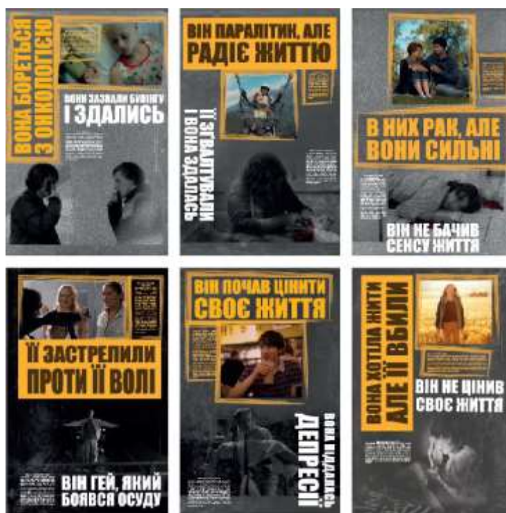
Рис. 2. Варіанти плакатів з використанням кольорових плашок