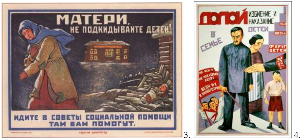
Рис. 3. А.Соборова «Матері, не підкидайте дітей!», 1925р.