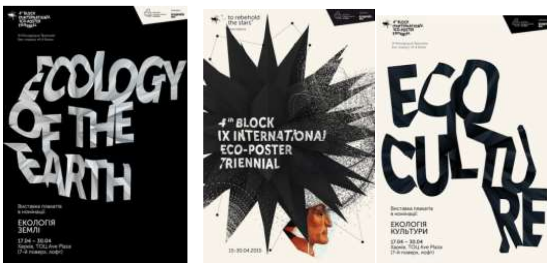
Рис. 1. Фестиваль «4-блок», експозиція плакатів: «Екологія людини», «Екологія Землі», «Екологія культури»