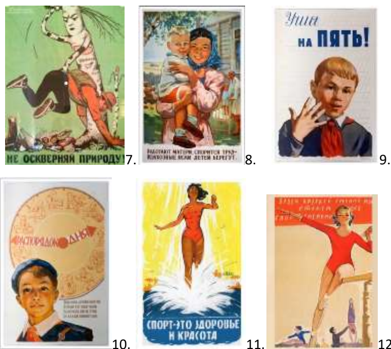
Рис. 7. Автор невідомий «Не оскверняй природу»