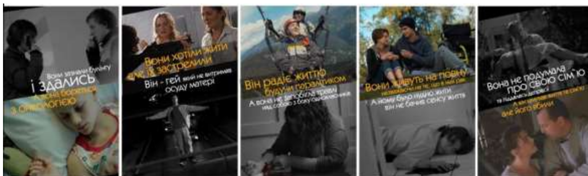
Рис.4. Варіанти плакатів із новими фразами (порівняння життєвих ситуацій героїв)