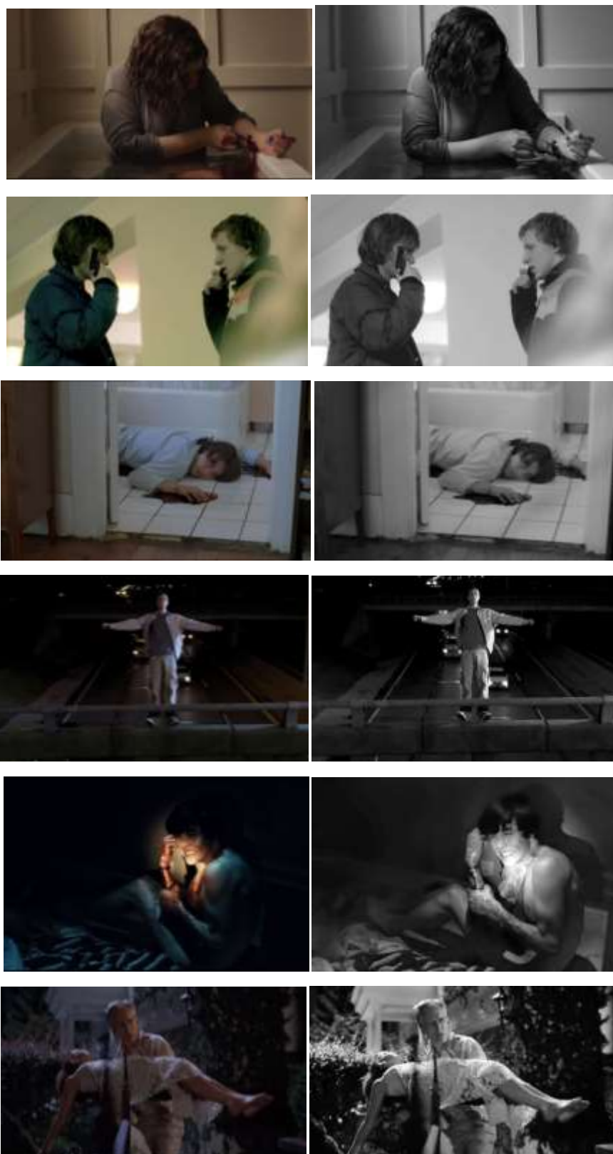
Рис. 2. Переведення фотознімків у чорно-білу колірну гаму