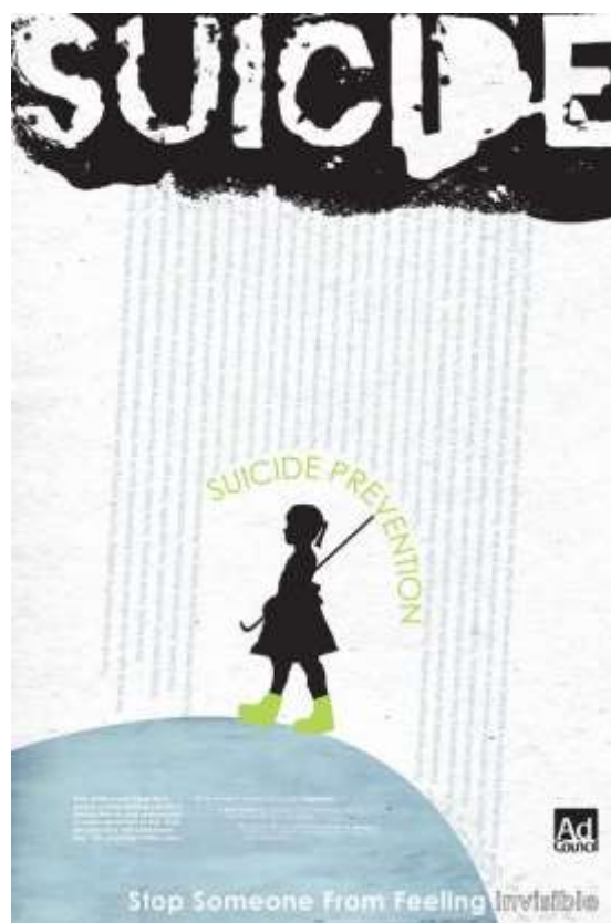
Рис. 2. Автор невідомий, Suicide Prevention Poster «Stop Someone From Feeling Invisible»