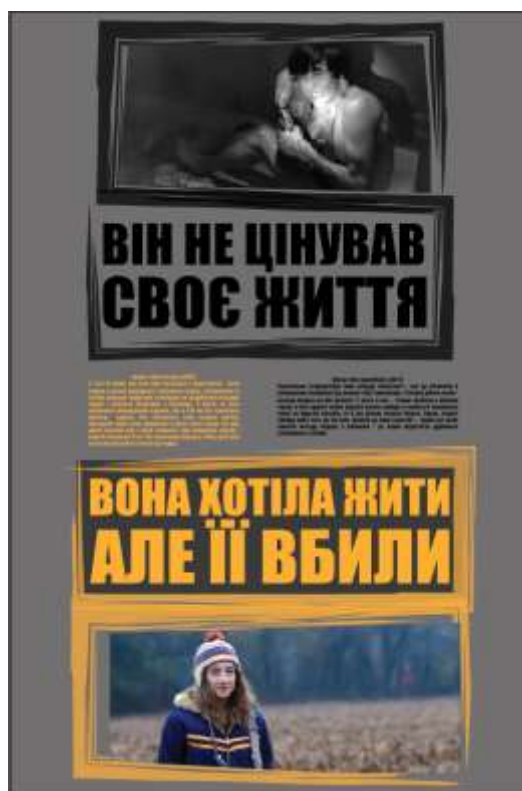
Рис. 5. П'ятий плакат