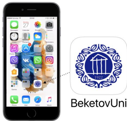
Рис. 3. Відображення іконки мобільного додатка-довідника ХНУМГ ім. О. М. Бекетова на екрані мобільного телефону

Підсумовуючи вищезазначене, можна визначити термін – адаптивний дизайн – як гнучку гармонійну візуалізацію, що забезпечує хороше сприйняття веб-сторінок на різних мобільних носіях, підключених до інтернету. Оскільки, поєднання високих технологій в дизайні та поширення інформації прослідковано на прикладі проникнення мобільних пристроїв у життя особистості, то можна визначити вплив адаптивного web-дизайну на основи фірмового стилю. Знак, логотип – будь-то товарний знак, або емблема університету – повинні коректно відображатись у друкованому виді і в інтернет-середовищі. Якщо на стадії розробки, або редизайні бренду дотримуватись принципів спрощення, узагальнення, характеристик впізнання форм знаку та логотипу, надаючи йому мультізадачні ознаки, то в майбутньому знак легко відобразити на мобільних платформах і пристроях.